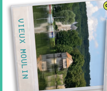
3 VIEUX MOULIN