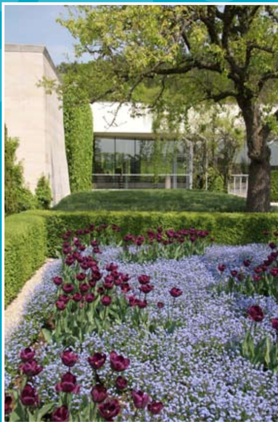
Musée des impressionnistes Giverny